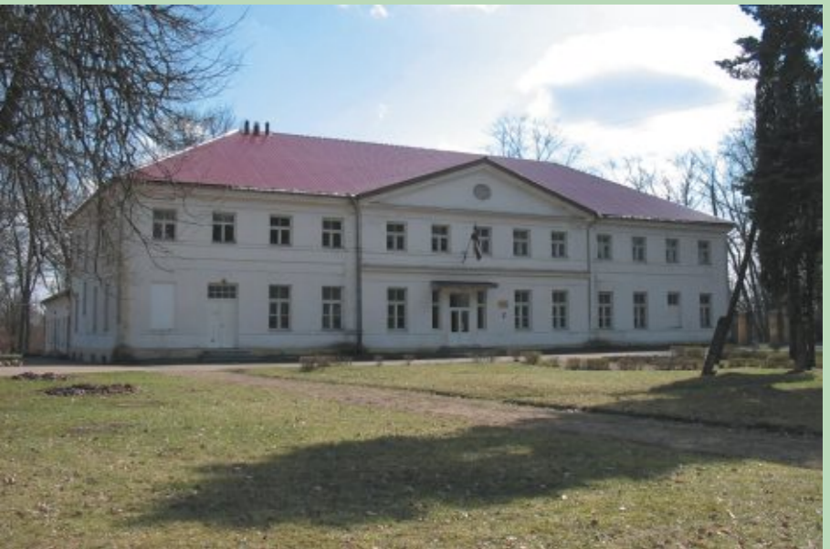
Litenes muižas apbūve iekļauta valsts nozīmes kultūras pieminekļu sarakstā