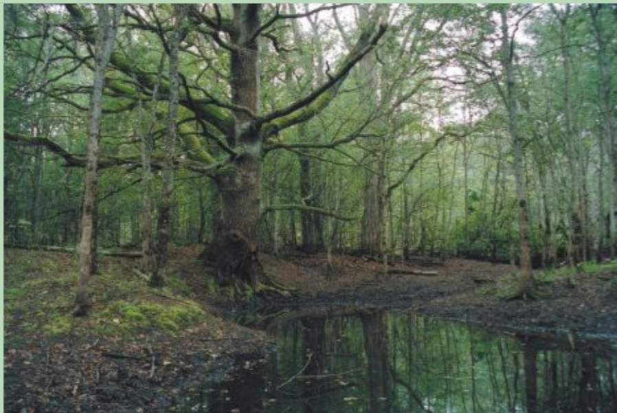
Jaukti ozolu, gobu un ošu meži upju palienēs - īpaši aizsargājams mežu veids

Liegumos sastopami arī 36 ha vecu mežu, kas nozīmīgi dabas daudzveidības saglabāšanā un atbilst dabisko meža biotopu kritērijiem. Šādiem mežiem raksturīgi lieli, veci koki, miruši koki, liela izmēra kritālas u.c. Šāda vide nodrošina dzīves apstākļus daudz vairāk sugām, nekā tas iespējams saimnieciskajos mežos. Lieguma meži, tai skaitā meži upju un vecupju krastos, ir dažādu īpaši aizsargājamu putnu sugu, piemēram, baltmugurdzeņu, vidējā dzeņa, melnās dzilnas, apodziņa u.c. barošanās un dzīves vieta.