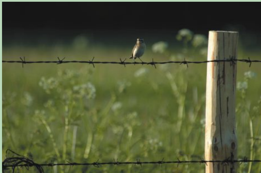
Printed on environment-friendly paper

Projekta norises laiks: 2004. gada oktobris - 2008. gada jūnijs Sadarbības partneri: Dabas aizsardzības pārvalde, Ziemeļvidzemes biosfēras rezervāts, Latvijas Ornitoloģijas biedrība, 22 pašvaldības – tai skaitā Litenes un Stražu pagasti. Finansētāji: Eiropas Komisijas LIFE–Daba programma, Apvienoto Nāciju Organizācijas Attīstības Programma, Pasaules Vides fonds, Latvijas Vides aizsardzības fonds. Norises vietas: 15 īpaši aizsargājamas dabas teritorijas - Natura 2000 vietas visā Latvijā: Sitas un Pededzes paliene, Mugurves pļavas, Pededzes lejtece, Dvietes paliene, Burgas pļavas, Sedas purvs, Vidusburtnieks, Rūjas paliene, Burtnieku ezera pļavas, Lielupes palienes pļavas, Svētes paliene, Kalnciema pļavas, Račupes ieleja, Durbes ezera pļavas un Ūzavas augštece. Projekta mērķi: ❖ bioloģiski vērtīgāko un pašlaik aizaugošo palieņu pļavu atjaunošana; ❖ ilgtspējīga palieņu pļavu apsaimniekošanas nodrošināšana, saglabājot apdraudētajām sugām piemērotus biotopus.