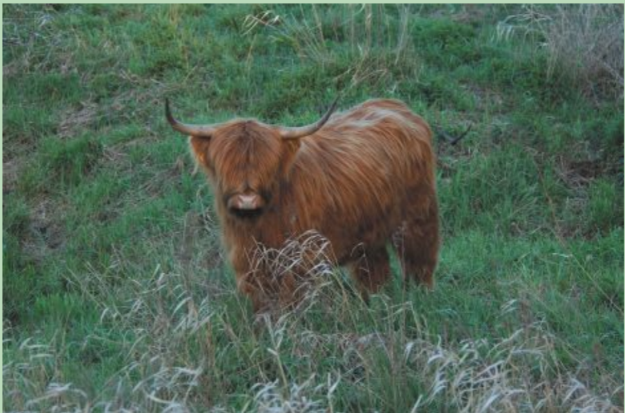
Hailander šķirnes lopī ir piemērojušies dzīvei zem klajas debess

Eiropas nozīmes aizsargājamo dabas teritoriju Natura 2000 statuss dabas liegumiem piešķirts, jo tajos sastopamas retas sugas un biotopi (pļavu, mežu un ūdeņu veidi). Daudzviet Eiropā, cilvēka nepārdomātās darbības dēļ, tie jau izzuduši, tādēļ svarīgi saglabāt tās dabas vērtības, kas liegumos sastopamas. Lielākajai daļai biotopu, kas sastopami liegumos, lai saglabātu reto augu un dzīvnieku sugu dzīvotnes, kā arī lai saglabātu pašus biotopus ir nepieciešami apsaimniekošanas pasākumi. Pļavas bez regulāras pļaušanas vai noganīšanas aizaug ar kokiem un krūmiem, kā tas bija vēl nesenā pagātnē. Lai tās atjaunotu un uzturētu, 2006. gada pavasarī Pededzes pļavās tika ielaisti no Nīderlandes atvestie Hailander šķirnes liellopi. Pļavās, kur neganās lopī, tiek nodrošināta vēlā pļaušana, lai netraucētu tur ligzdojošos putnus.