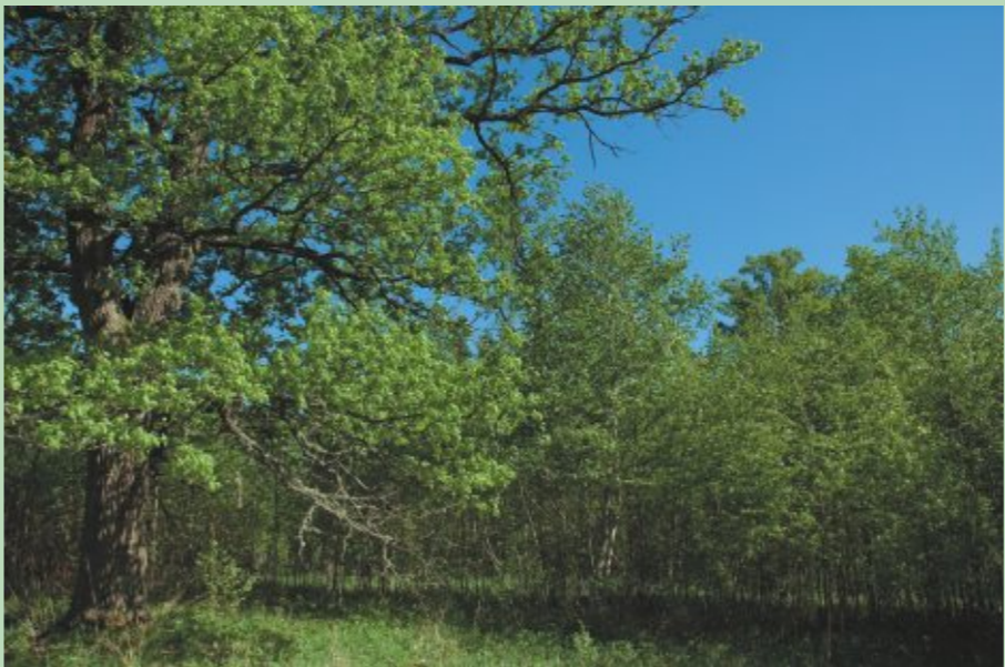
Veco ozolu kuplais zarojums liecina, ka tie kādreiz auguši klajumā

Ap lielajiem, savrupus augošajiem vecajiem kokiem, galvenokārt ozoliem, tiek veikta krūmu izciršana, lai nodrošinātu tiem gaišākus apstākļus un paildzinātu to mūžu. Šādi koki ir dzīvesvieta dažādām kukaiņu sugām, kā arī dažādām gaismas prasīgām ķerpju sugām.