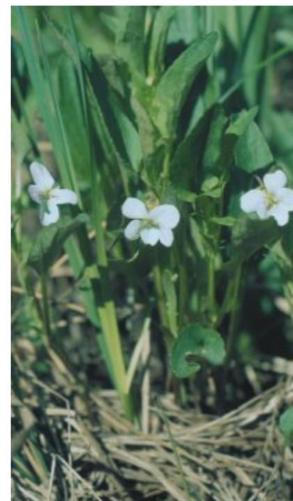
The Fen Violet is a specially protected species that is found only in the floodplains of rivers in the Eastern Latvia

Most of the meadows found in the reserves are protected type and they are among the most valuable natural features there. Biodiversity in the meadows is enhanced by single, old oak trees typical landscape elements of the Pededze River valley. The old hollow trees are suitable habitats for a number of protected insects, including the Hermit Beetle, which is endangered across the Europe. The Pededze River valley is one of the most important sites in Latvia that the beetle inhabits. The Great Snipe is among the most notable protected bird species found in the meadows; the Pededze floodplain is one of five best locations for this bird in Latvia.