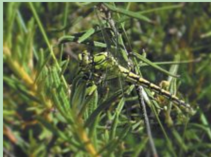
Zaļā upjuspāre ir labi maskējusies uz apkārtnes fona