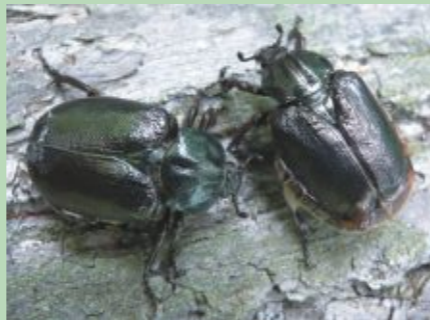
Lapkoku praulgrauzis ir grūti novērojama suga, kas lielāko dzīves daļu pavada koku dobumos

Dabas daudzveidību pļavās palielina atsevišķi augoši veci ozoli, kas ir raksturīgs Pededzes ielejas ainavas elements. Veco koku dobumos dzīvo vairākas īpaši aizsargājamas kukaiņu sugas, no kurām viena suga - lapkoku praulgrauzis - ir apdraudēta suga visā Eiropā. Pededzes ieleja ir viena no nozīmīgākajām šīs sugas atradnēm Latvijā.