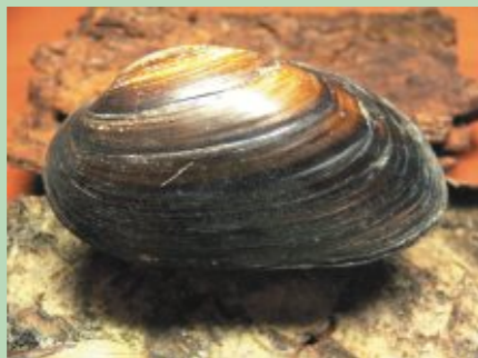
Biezā perlamutrene dzīvo dabiskās un tīrās ūdenstecēs

Dažādi ūdeņi - upes, vecupes, bebru uzplūdinājumi u.c. - dabas liegumos sastopami lielā platībā, ar tiem saistītas arī vairākas īpaši aizsargājamas sugas, piemēram, Pededzē sastopama zaļā upjuspāre un biezā perlamutrene. Nozīmīgākā dabas norise, kas ietekmē liegumus ir palī. Palu laikā ar ledu tiek izrauti krūmi - tādējādi veidojas klajas platības; ar ūdeņiem palienē tiek ienestas barības vielas - veidojas auglīgas palieņu augsnes. Liegumu vērtības apdraud meliorācija, jo pa izveidotajiem grāvjiem ūdens ātrāk aizplūst. Grāvjiem aizaugot ar krūmiem, plašās, vienlaidus palieņu pļavas tiek sadalītas fragmentos. Meliorācijas rezultātā šīs vietas vairs nav piemērotas palieņu pļavu putniem, arī augu valsts kļūst vienmuļāka.