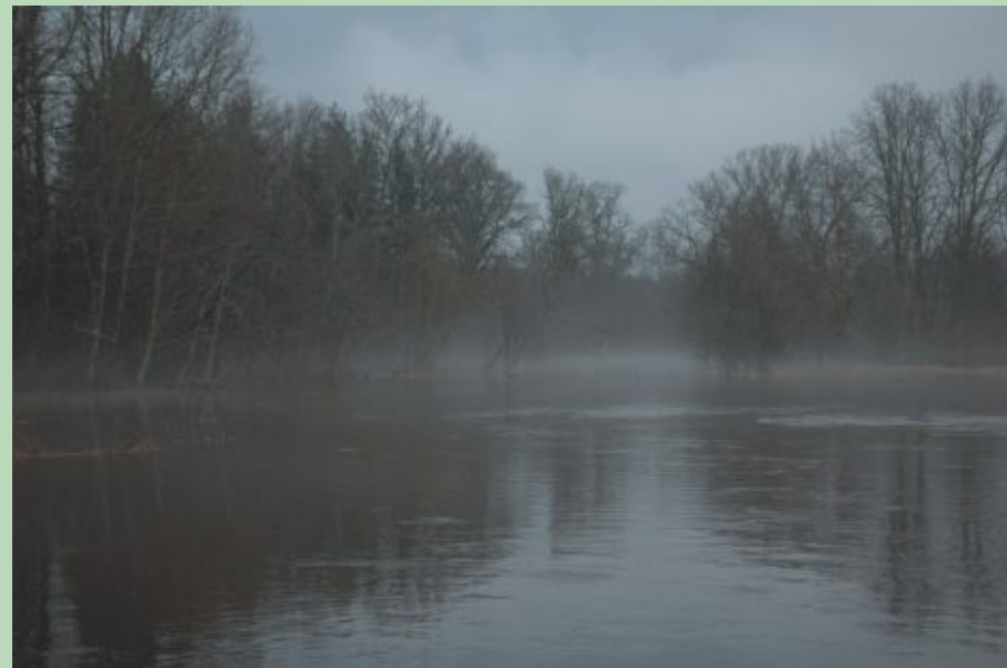
Palu laikā lielākā daļa liegumu teritorijas ir pārplūdusi, tajā pārvietoties iespējams tikai ar laivu