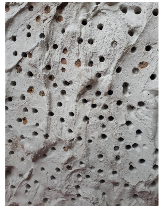
Ģipša lējums saurbts

Vientuļās bites ir atšķirīgas pēc ķermeņa izmēra, nepieciešamas dažāda diametra aliņas – 3-8 mm, dziļums ap 10 cm. Kukaiņiem nav tik svarīgs mājas kopējais izmērs, tie var apdzīvot arī pavisam niecīgu telpu. Niedru kūlītis vai saurbts baļķītis arī var būt patstāvīga dzīvotne bitēm u.c. Var saurbt arī nokaltušu koku. Interesanti vērot!