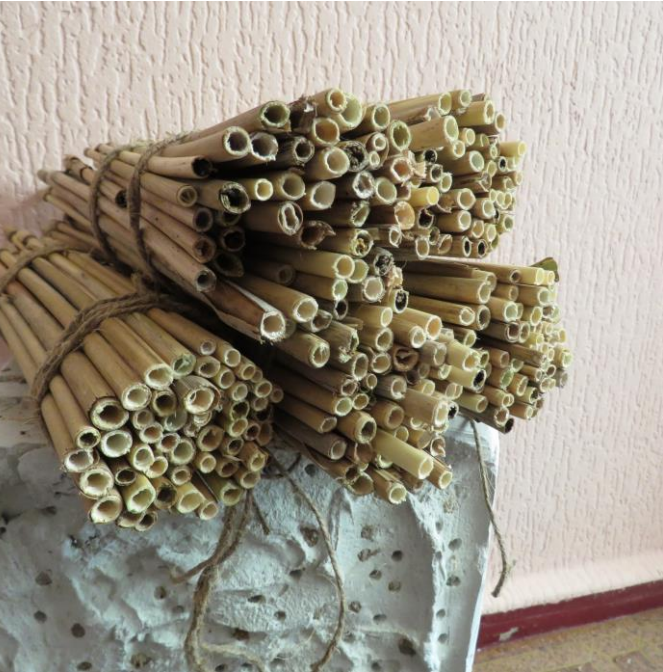
Sagrieztu niedru kūlīši