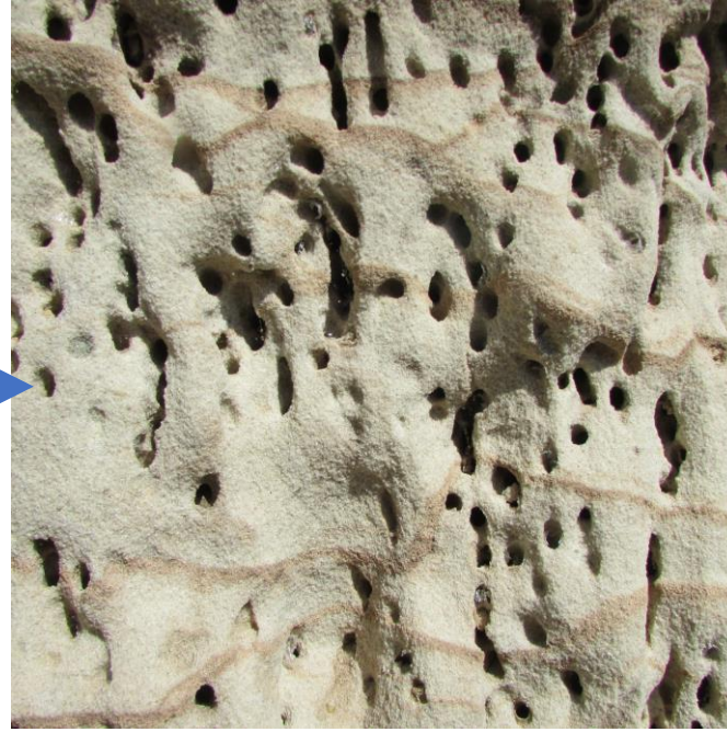
Bišu aliņas smiltsakmens iezī Sietiņiezī. Lielākā zīdbišu kolonija Latvijā.

Vientuļajām bitēm ir svarīgi viegli drūpoši minerāli alu veidošanai un pēcnācēju audzināšanai. Tādu vietu ir visai maz – upju piekrastes atsegumi, smilšakmeņu atsegumi. Galvenais, lai bites varētu tīrīt un paplašināt aliņas. Noder ģipša lējumi un māls.