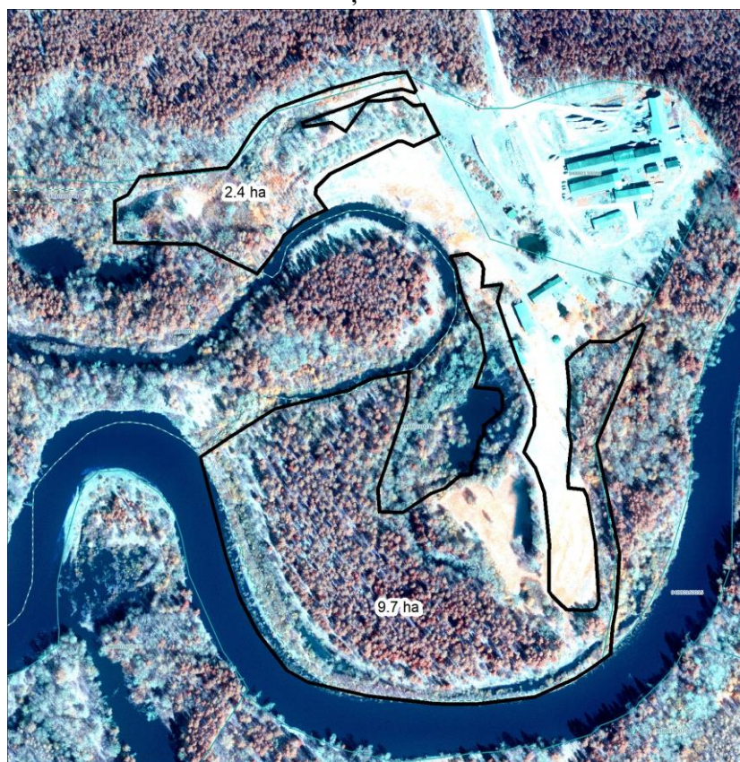
Darbu veikšanas vieta LĢIA 06/06/2015 ortofoto kartē